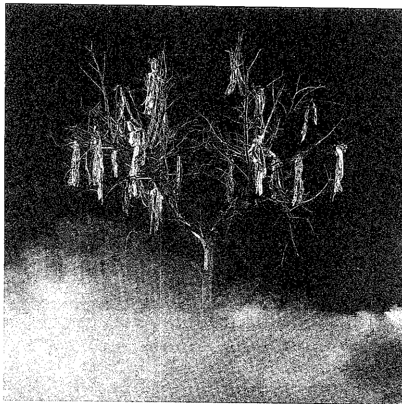
טל שוחט, ללא כותרת, 2005, 121x121 ס"מ

(ז) ניתן, לבסוף, לשאוב עידוד מהיריעה שהבעיות ששורטטו הן בבחינת הכלל עבור היסטוריה של תנועות חברתיות. תנועות חברתיות הן שחקניות אמורפיות מטבען, אשר מתחמקות מתחייבות גבולות ברורים. 36 גם השפגאט בין יומרה מדעית וחברות אישית בתנועה מוכר היטב מההיסטוריה של תנועות הפועלים. האם יהיה זה יומרני להציג את ההיסטוריה של תנועות הפועלים כאזהרה בפני משגים אפשריים בהיסטוריה של התנועה הסביבתית? ההיסטוריה של תנועות הפועלים היא הרוגמה הקלאסית לשדה מחקר שאכן התמוטט תחת כובד משקלם של עוד ועוד מחקרים נקודתיים. על רקע זה, ניתן להעיר באינחת מסוימת שבינתיים נערמים להם חקרי מקרה גם בתחום ההיסטוריה הסביבתית. לפיכך, פיתוח תיאוריות לטווח בינוני והדיון בהן הנם ככל הנראה המצרך המבוקש ביותר של המחקר נכון להיום.