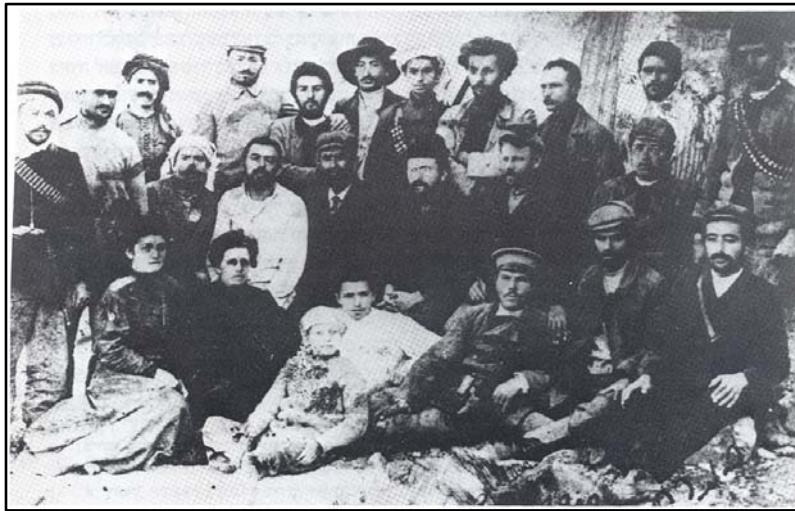
קבוצת כינרת, 1908

בדבריו של נדב שוב מהדהדת אותה הווייה גברית מאוד, שהנשים כאילו הורשו להיכנס אליה אך לא עמדו בציפיות. לדעת הגברים הן לא היו מוכנות למלא את התפקיד שנועד להן, ואף היו שהתלוננו על בנות העלייה השנייה שהן גבריות מדי או ששכחו את ייעודן הנשי. 15 נראה שדברים אלה משקפים מידה רבה של תסכול.