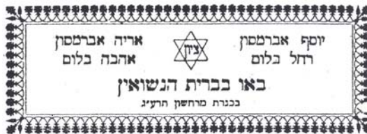
מודעה על חתונה מ'1913