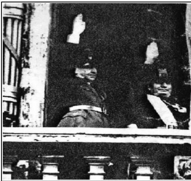
מנהיגה הנאצי של קרואטיה אנטה פאבליץ' עומד לצידו של מנהיג איטליה הפשיסטית מוסוליני. הסיבה האמיתית לאי-הסגרתו ליגוסלביה הייתה היריבות עם הקומוניזם.