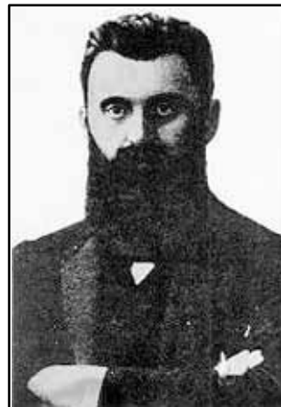
בנימין זאב (תיאוזו) הרצל תמונה משנת 1893, בתקופה ששימש שליח העיתון Neue Freie Presse האוסטרי בפריז. השנים בצרפת (1891–1895) חשפו לפניו את החיים הפוליטיים ואת המשנות האידיאולוגיות של הרפובליקה הצרפתית השלישית.

הרצל פרסם את ספרו 'מדינת היהודים' בשנת 1896 בעקבות רשימות שכתב ביומנו ביוני 1895 בפריז. באותו זמן הוא סיים שהייה בת ארבע שנים (בין השנים 1891–1895), שבהן שימש שליח העיתון Neue Freie Presse האוסטרי בפריז. ייתכן שיש למצוא את המקור לרעיון לעיל בדיונים שהתקיימו באותה תקופה בצרפת, שהרצל – ככתב פוליטי – נחשף להם יום יום. 2