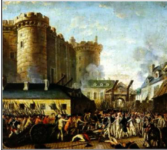
כיבוש הבסטיליה ב-14 ביולי 1789 בצדק או שלא בצדק נחשבו רעיונותיו של רוסו למקור השראה למהפכה הצרפתית.

שרוסו ורעיונותיו נחשבו מבססי אידאולוגיות מהפכניות ולפיכך הם נשללו בתוקף. מאוחר יותר, בשנות השמונים של המאה התשע עשרה, הייתה עדנה מחודשת לתאוריית האמנה החברתית, והוגים שונים חיפשו דרכים לשוב אליה, אם כי בגרסאות וניסוחים משוכללים יותר.