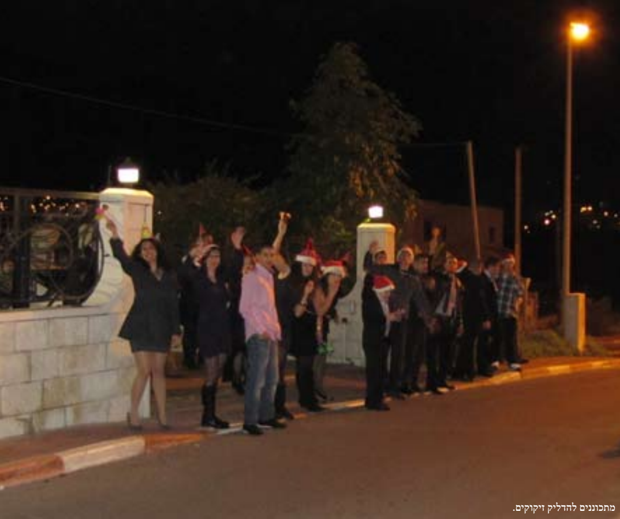
מתכוננים להדליק זיקוקים.