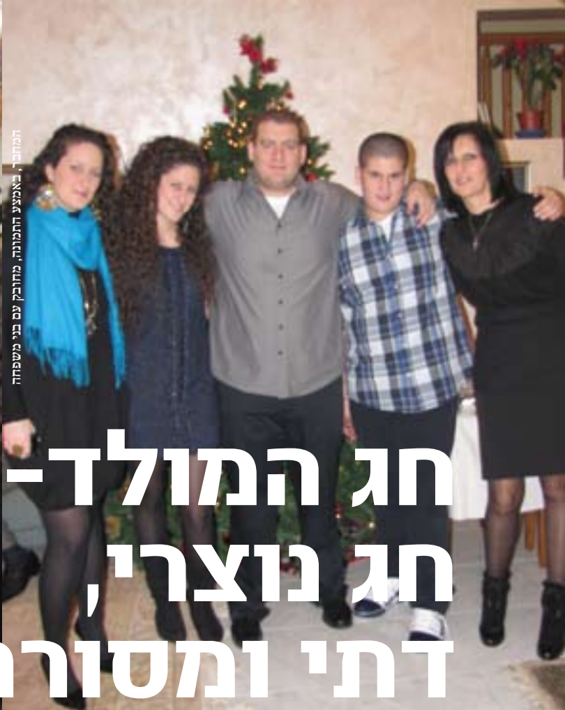
המחור, באמצע התמונה, מחובק עם בני משפחה