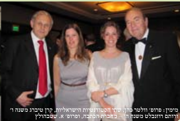
מיה נשע (5) אדר ב' תשע"א - אביב 2011