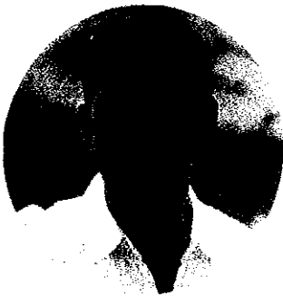
עפ'ר'י ד'בי'ב. 'אדם עם מוגבלוהת שלא יוצא לעבוד הופך להיות תלוי בד'רו'נס הטוב של אחר'ים"

המסעדות נבחרו על-פי דירוגן באתרי אינטרנט כמסעדות המומלצות בירושלים. רבים מנציגי המסעדות הביעו נכונות לשינוי המצב הקיים. נהוגים: הקליניקה לזכויות אנשים עם מוגבלויות