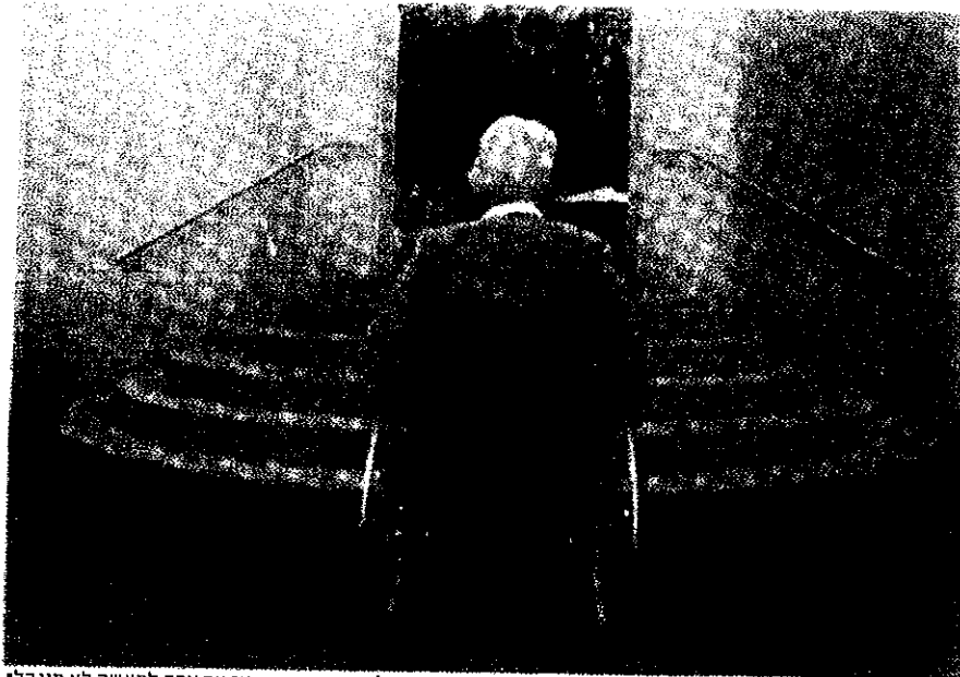
"אם כל החברה נגישה, אז אף אחד למעשה לא מוגבל". צילום אילוסטורציה